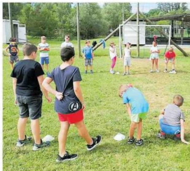
Il centro estivo a Rio Cavalli