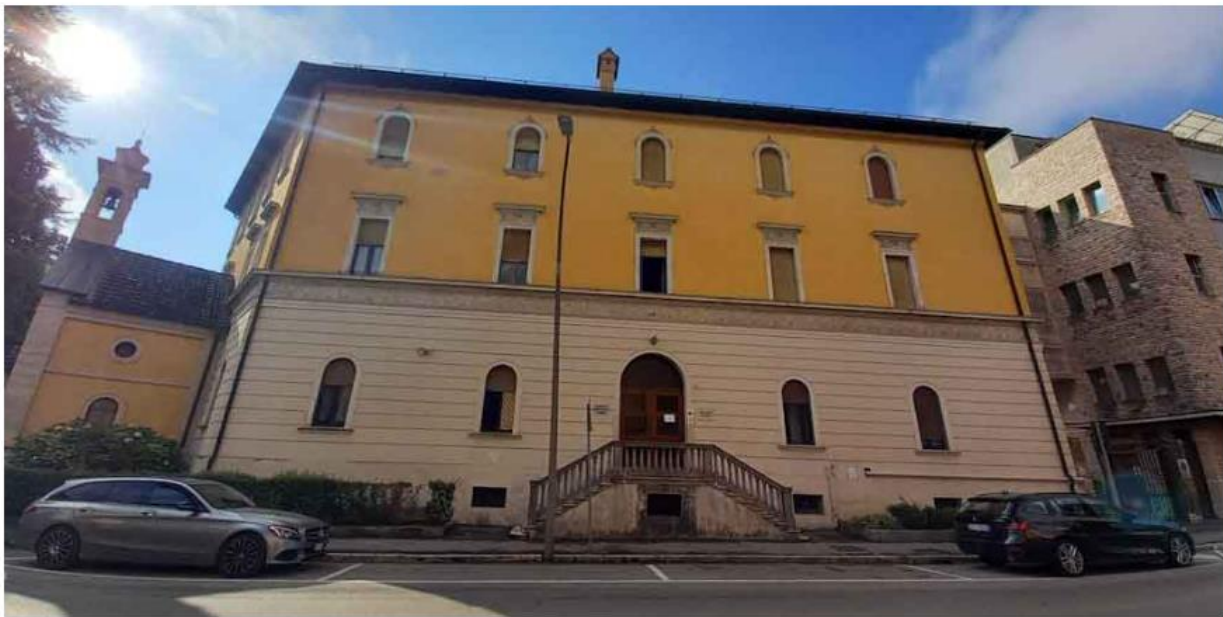
Istituto Sperti – Belluno via Feltre

Belluno, 28 luglio 2022 – Sono aperte le iscrizioni per il prossimo anno scolastico all’Istituto Sperti di Belluno. L’Opera diocesana San Martino – che fa riferimento alla diocesi di Belluno-Feltre – ne ha infatti affidato la gestione alla cooperativa Kairos di Roma, che opera da tempo nella zona del Bellunese con alcuni nidi per l’infanzia e che in questi mesi sta curando il Centro Estivo organizzato proprio nella storica struttura creata nel 1855 da don Antonio Sperti.