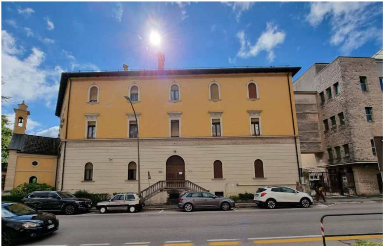
Istituto Sperti, Belluno via Feltre